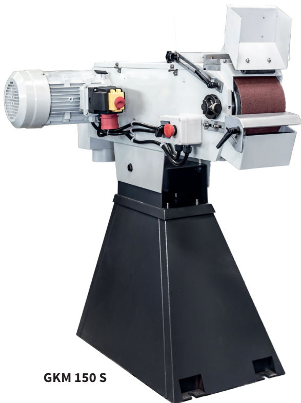
GKM 150 S

Kurz gesagt: robust, leistungsstark und wirtschaftlich. Unser neues Modell der Doppelschleifmaschine GKM 300 S, bietet Ihnen mit einer Drehzahl von bis zu 1.450 U/min und seinem durchzugsstarken Motor mit 2,2 kW all das was Sie von einer Schleifmaschine erwarten.