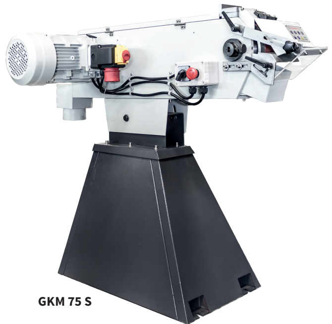
GKM 75 S